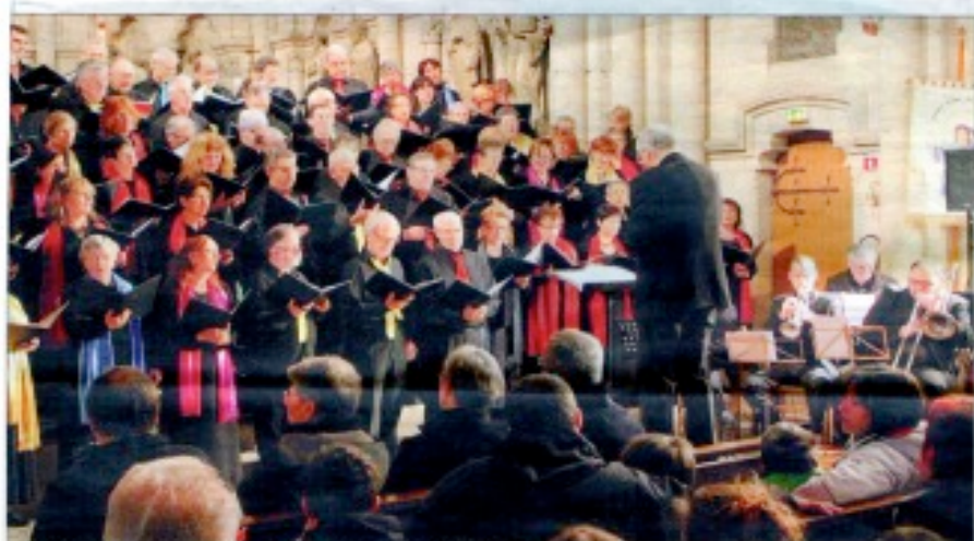
Plus de 60 choristes et six musiciens dans l'église Notre-Dame, dimanche.