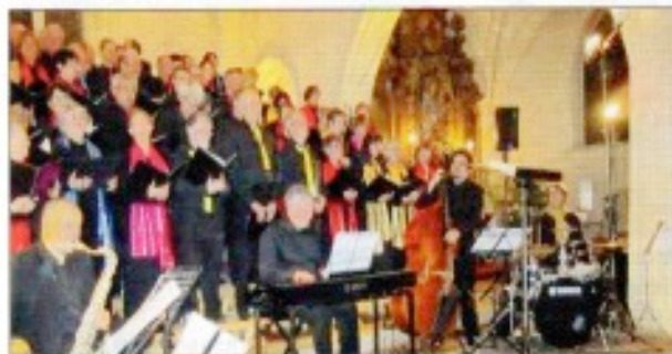
L'ensemble Ariana dans l'église Saint-Jacques de Castelnau.

Il y a bien longtemps que l'église Saint-Jacques de Castelnau n'avait connu autant de public de mélomanes, ce samedi 3 novembre dernier, en soirée.